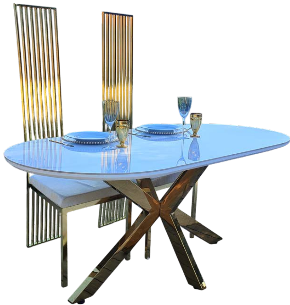
TABLE D'HONNEUR AVEC FAUTEUILS DORES